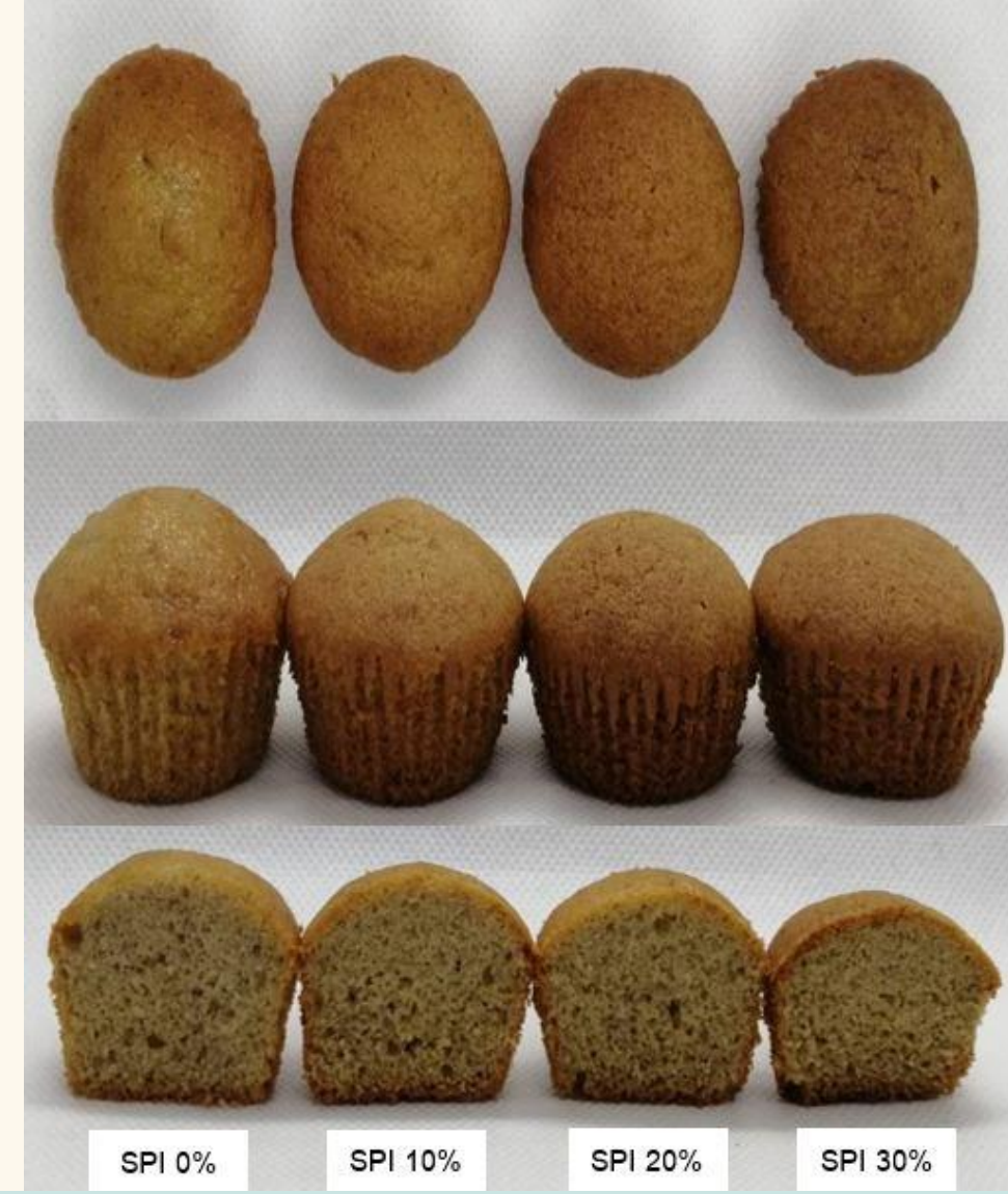
Fig.2 The appearance of banana cakes substituted with soy protein isolate (SPI) at different levels.

Fig.2 แสดงลักษณะปรากฏของเค้กกล้วยหอมที่มีการทดแทนแป้งสาลีด้วยโปรตีนถั่วเหลืองสกัด ซึ่งสอดคล้องกับค่า Specific volume เมื่อวิเคราะห์ค่าสีของเค้กดัง Table 4 พบว่า สีของเค้กที่มีการทดแทนด้วยโปรตีนถั่วเหลือง สกัดส่งผลให้ค่า L* และค่า b* ลดลง ในขณะที่ค่า a* และค่า Browning index มีค่าเพิ่มขึ้นอย่างมีนัยสำคัญทางสถิติ (p<0.05) เมื่อเทียบกับสูตรควบคุม เป็นผลจากปฏิกิริยาเมลลาร์ด (Maillard reactions) ที่เกิดขึ้นระหว่างน้ำตาลและกรดอะมิโน ประกอบกับการเกิดกระบวนการคาราเมลไลเซชัน (Caramelization) ของน้ำตาลระหว่างการอบ ดังนั้นเค้กที่มีปริมาณโปรตีนสูงจึงเกิดปฏิกิริยาสีน้ำตาลได้มากกว่าเค้กที่มีปริมาณโปรตีนน้อย (Sahagún et al., 2018)